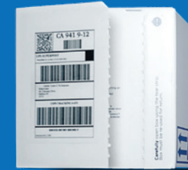
Caja de envío