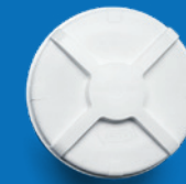
Recipiente para la muestra