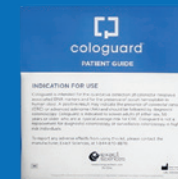
Guía para el paciente