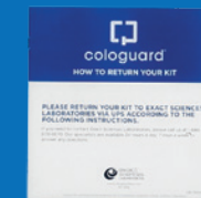
Cómo devolver su kit