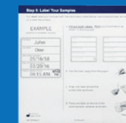
Etiquetas para la muestra