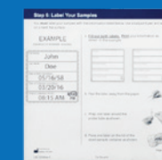
Étiquettes pour échantillon