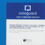
Comment retourner votre kit ?