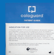
Guide du patient