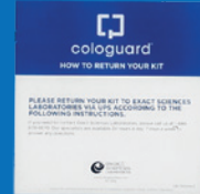
كيف تعيد مجموعة أدواتك